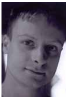
Рисунок Р. Козьмина