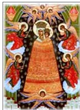
Икона «Прибавление ума»

Тем не менее за два прошедших года я впервые спустилась со своего третьего этажа на землю, и произошло это 28 июня — тем этот день и знаменит. На улице было жарко, но временами дул холодный порывистый ветер. Вот тут-то мне и пригодились твои подарки: шерстяной платок и бирюзовый свитерочек. Накрылась всем этим и все вре-