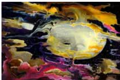
«Сотворение мира» Художник Иван Хохлов

Что касается второго Вашего вопроса, то обо всем этом Вы прочитаете в моей книге, а то долго пере-сказывать.