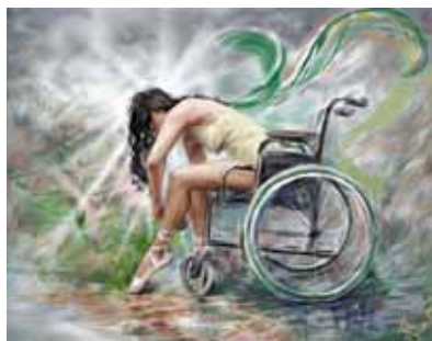
Рисунок М. Смбалян

Марианна Смбалян, Украина, г. Запорожье 19 января